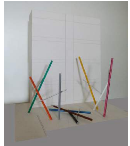
What If? , Christoph Dahlhausen, pulverbeschichtetes Stahl- und Edelstahlrohr, verschraubt, 2012

Der Entwurf What if? von Christoph Dahlhausen bestach durch die gelungene Auseinandersetzung mit der Historie des Ortes und der Architektur brandtelfs . In der Endabstimmung erhielt What if? den 1. Platz und Christoph Dahlhausen somit den Zuschlag für die Realisierung. Die Jury hob in ihrer Begründung hervor, dass Dahlhausens Entwurf die Aufgabe, die Gestaltung eines Kunstraumes, vorbildlich gelöst hat.